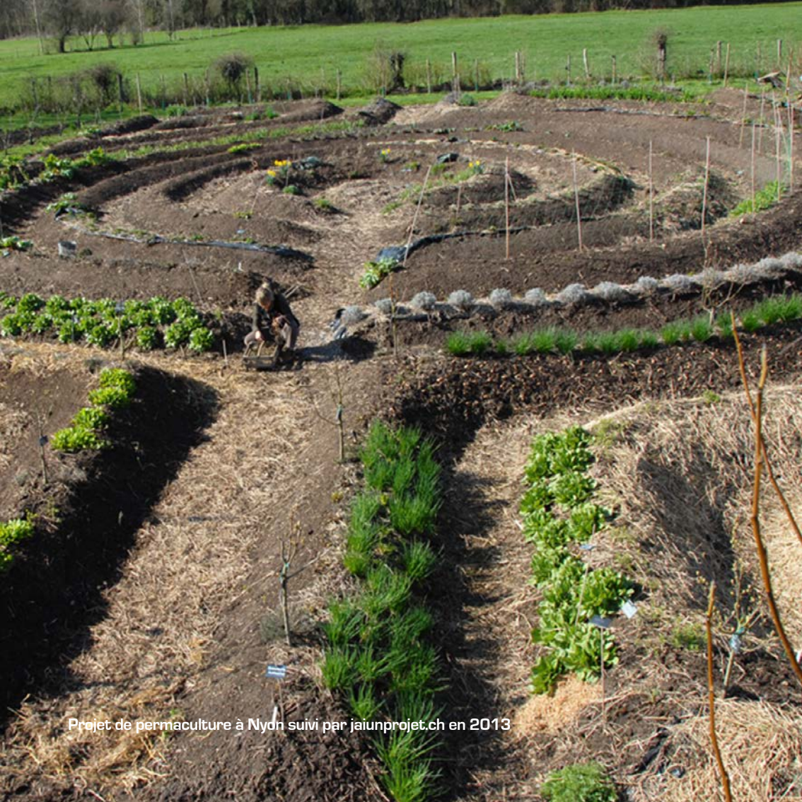
Projet de permaculture à Nyon suivi par jaiunprojet.ch en 2013